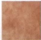
PIASTRELLA in grès [Iperceramica € 6,90 al mq].