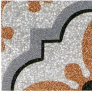
CEMENTINA D_Segni decoro Tappeto con scaglie di marmo [Marazzi, cm 20x20].

In una dimora storica è importante riproporre finiture simili alle originali come il cotto, il marmo e le cementine.