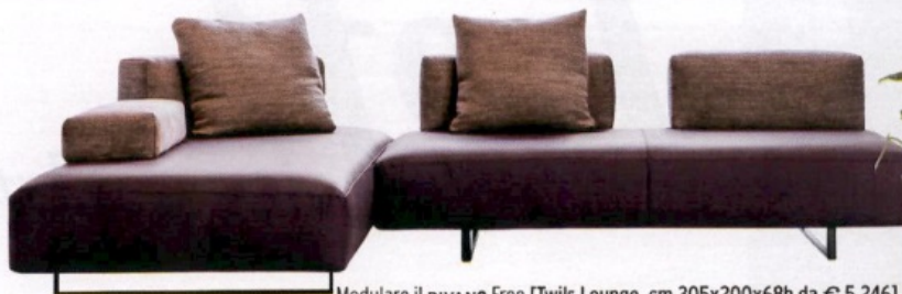
Modulare il DIVANO Free [Twils Lounge, cm 305x200x68h da € 5.246].